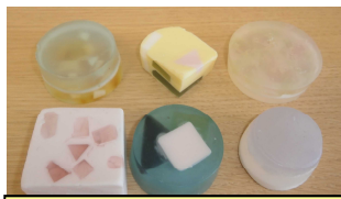
おみやげのサンプル